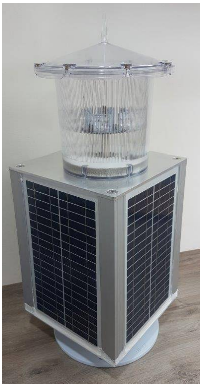
TM - PRODUTO PATENTEADO

Com 22 anos de Mercado Nacional, as Lanternas para Sinalização Náutica fabricadas pela BLEST do Brasil, são compactas, autônomas e seu funcionamento é totalmente automático.