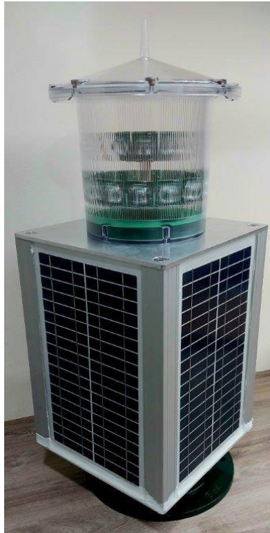
TM - PRODUTO PATENTEADO

Com 22 anos de Mercado Nacional, as Lanternas para Sinalização Náutica fabricadas pela BLEST do Brasil, são compactas, autônomas e seu funcionamento é totalmente automático.