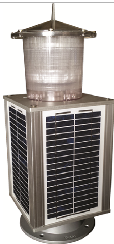
TM - PRODUTO PATENTEADO

Com quase 20 anos de Mercado Nacional, as Lanternas para Sinalização Náutica fabricadas pela BLEST do Brasil, são compactas, autônomas e seu funcionamento é totalmente automático.